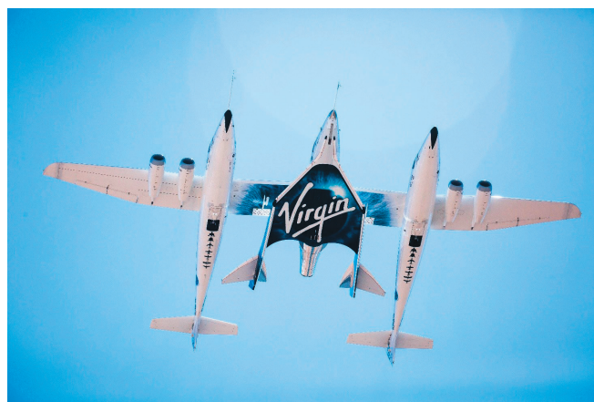
Рис. 3. Компания Virgin Galactic организует туристические суборбитальные полеты на своем космолете SpaceShipTwo.

Интерес не в смысле возможности купить и запустить спутник дешевле, чем это было 10 лет назад. И не в смысле – пока титаны, связанные с государством, реализуют свои частно-государственные проекты – можно арендовать у них немного места и запустить что-то своё. В отношениях с титанами и государством есть риск того, что и государство, и титаны могут внезапно найти более насущные дела на Земле, и для небольшого частного заказчика очередной запуск превратится в покупку места в спасательной шлюпке на Титанике. Да, эта сделка