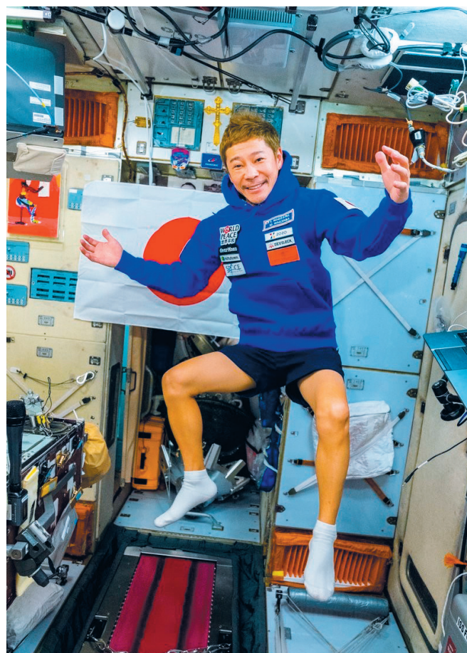
Рис 4. Японский миллиардер Юсаку Маэзава внутри Российского сегмента МКС во время своей туристической миссии в декабре 2021 г.

В остальном – вопрос в деталях, которые отличают бизнес от хобби для энтузиаста. В масштабах спроса и цены на эти услуги. То есть в том, кто сможет себе позволить космические услуги, насколько они действительно востребованы и можно ли на них построить устойчивый, регулярный бизнес с интересным для инвесторов сочетанием доходности и риска. К сожалению, признаков удачного решения этого вопроса и примеров построения какого-то нового бизнеса в космосе с понятными финансовыми параметрами, который можно противопоставить производству