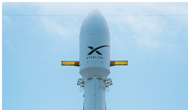
Рис.1. Обтекатель ракеты-носителя Falcon 9, которая служит для запуска спутников Starlink

Таким образом, основная доля запусков приходится на проект Starlink (рис. 1). В остальных запусках доминируют госагентства и 5 компаний, которые более 20 лет предоставляют телекоммуникационные услуги