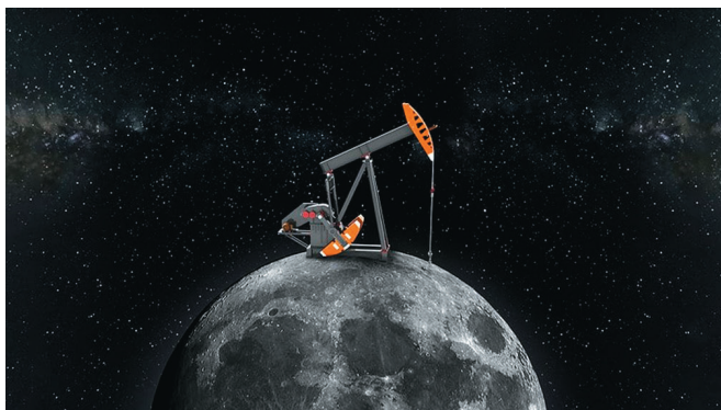
Рис. 5. Коллаж на тему добычи ресурсов на Луне.

на дне океана. Речь не об углеводородах, с их добычей на шельфе нефтяники и газовщики давно отлично справляются, а о золоте, цинке, марганце, серебре и меди. Да, есть своя специфика – на дне морском, в отличие от Луны, высокое давление. Но, согласитесь, морское дно гораздо ближе, чем Луна, да и с давлением на глубинах до 3 км человечество научилось справляться, спросите тех же нефтяников-газовщиков с их подводными добычными комплексами. Однако в последние годы тема подводной добычи минералов из СМИ почти исчезла. Наверное потому, что пионер этого направления – компания Nautilus Minerals, основанная в 1987 году, несмотря на разработку специального оборудования для добычи, пробное бурение скважин в 2007 году и подтверждение значительных запасов золота и меди на соответствующих месторождениях, не пережила затянувшуюся на 30 лет инвестиционную фазу и в 2019 году подала на банкротство.