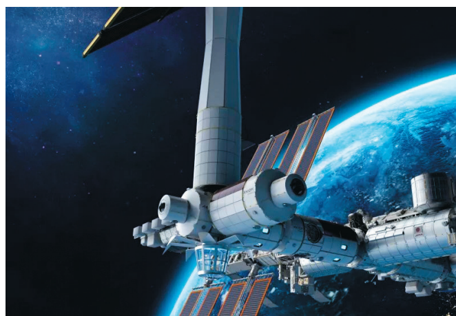
Рис. 2. Проект космической станции, которую планирует развернуть на орбите частная компания Axiom Space.

И, наконец, три пуска “Smallsat rideshare program mission” (105, 40 и 59 малых спутников). Это, наверное, как раз те немногие запуски аппаратов с «высокой будущей стоимостью функций, которые они могут предоставлять непосредственно на орбите, таких как обслуживание на орбите, НИОКР и производство» [4]. Большинство из них можно отнести к двум группам – «демонстраторы возможностей» и «изучение Земли из космоса». Как-то пока не тянет ни на прорыв бизнеса в космос, ни на переломный момент его коммерческого освоения.