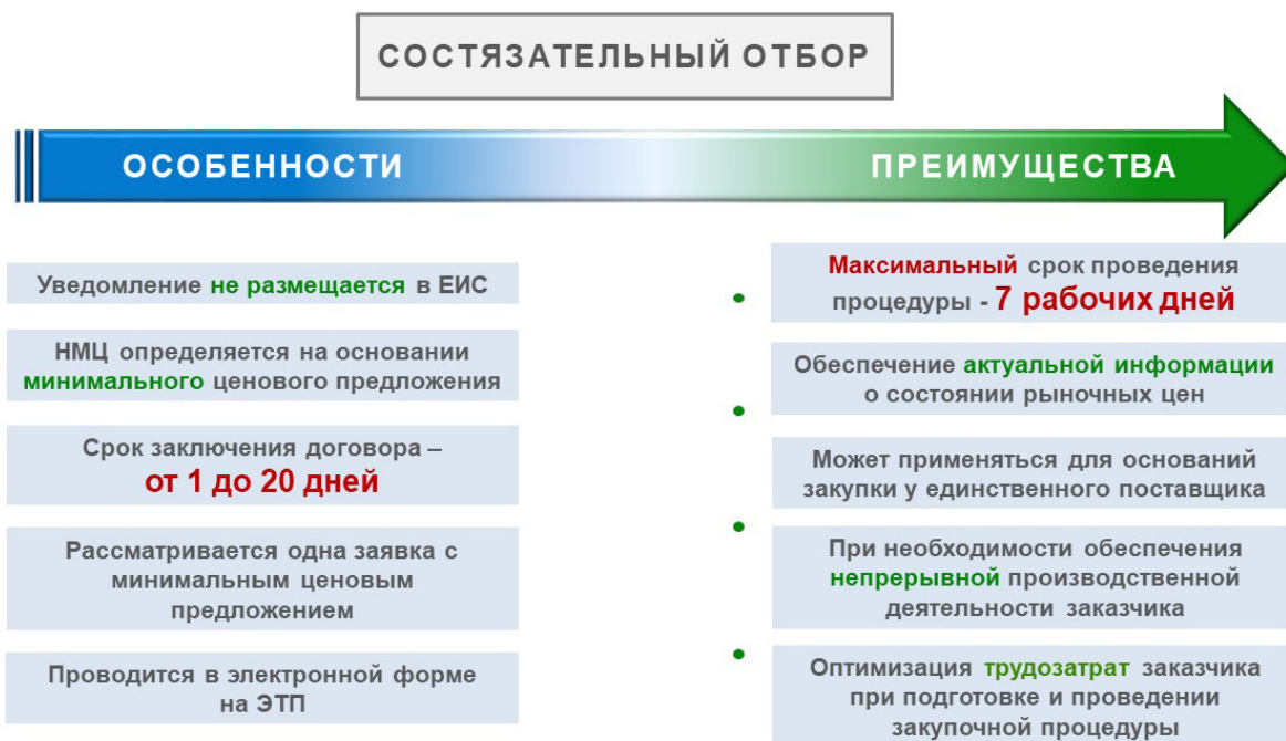
Рис. 2. Новый неконкурентный способ закупки

в Положение о закупке (в редакции с изменениями, утвержденными решением наблюдательного совета Госкорпорации «Роскосмос» от 13.09.2022 № 56-НС), обобщающие собственный накопленный правоприменительный опыт, методологию и лучшие практики крупнейших российских Заказчиков в сфере регламентированных закупок.