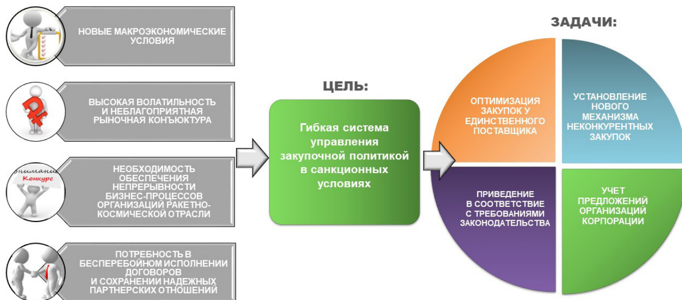
Рис. 1. Изменения в Положении о закупке

N 5663-1 «О космической деятельности», а также нормативно-правовое регулирование в данной области.