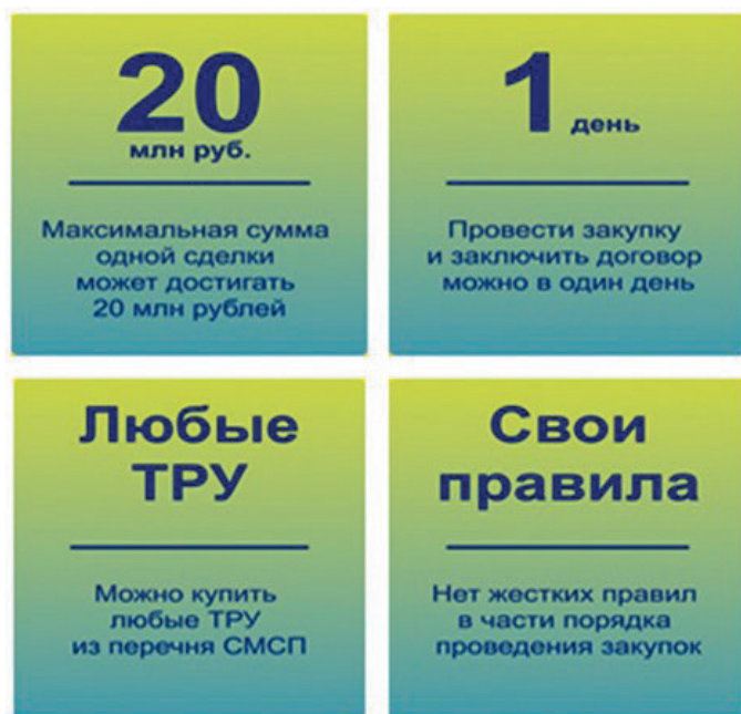
Рис. 1. Преимущества закупок через «Электронный магазин».

инфраструктура), услуг, необходимых для использования этого ПО на таких объектах.